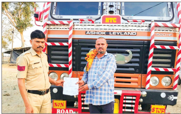
हरिभूमि न्यूज़ ► कमलापुर