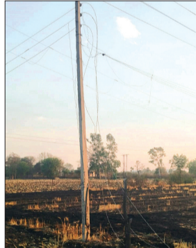
के खंभे पर बिजली के तार टूट कर खेत में गिरने से तार स्पार्क हुए और

बिजली विभाग की लापरवाही के कारण आए दिन खेतों में आगजनी हो रही है, जिसका खामियाजा किसानों को भुगताना पड़ रहा है। एक बार फिर चापड़ा के हाटपीपल्या मार्ग पर बिजली का तार टूटने के कारण खेत में आग लग गई जिसमें किसानों का हजारों रुपए का नुकसान हुआ है।